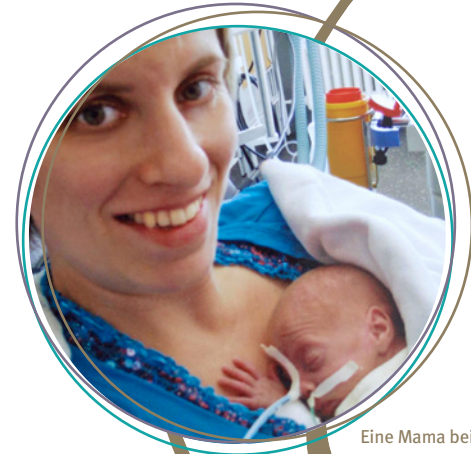
Eine Mama beim Känguruhen.

WÄHREND ICH MIT MEINER MUTTI KUSCHLE, SPRICHT SIE NOCH KURZ MIT DEM PFLERGER. NACH EINER WUNDERSCHÖNEN STUNDE BEI MEINER MAMA, IN DER SIE MIR VIEL ERZÄHLT HAT, GEHT ES ZURÜCK IN DEN WARMEN INKUBATOR.