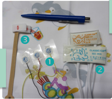
Diese Kabel überwachen ① meine Herzfunktion, ② meinen Blutdruck und ③ meine Sauerstoffsättigung.

Heute ist ein ganz besonderer Tag! Ich habe keine Katheter mehr in meinem Nabel, weil ich viel weniger Medikamente und Infusionen brauche. Das Essen über die Magensonde klappt auch schon ganz gut, da ich die Milch, die ich zwischenzeitlich schon bekomme, gut verdaue. Und auch meine Blutwerte müssen nicht mehr ständig kontrolliert werden. Ich habe nun einen ganz dünnen zentralen Katheter in meinem Füßchen, anstatt dem Nabelvenenkatheter. Deshalb darf ich heute zum ersten Mal aus meinem Inkubator heraus auf Mamas Arm. Meine Mami hat dafür extra ein T-Shirt zum vorne aufknöpfen angezogen. Ich merke, sie ist ganz schön aufgeregt, aber mir geht es genauso! Nun wird ein Liegestuhl neben dem Inkubator aufgestellt, auf dem es sich Mama bequem macht.