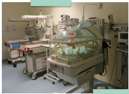
Reanimationseinheit im Kreißsaal